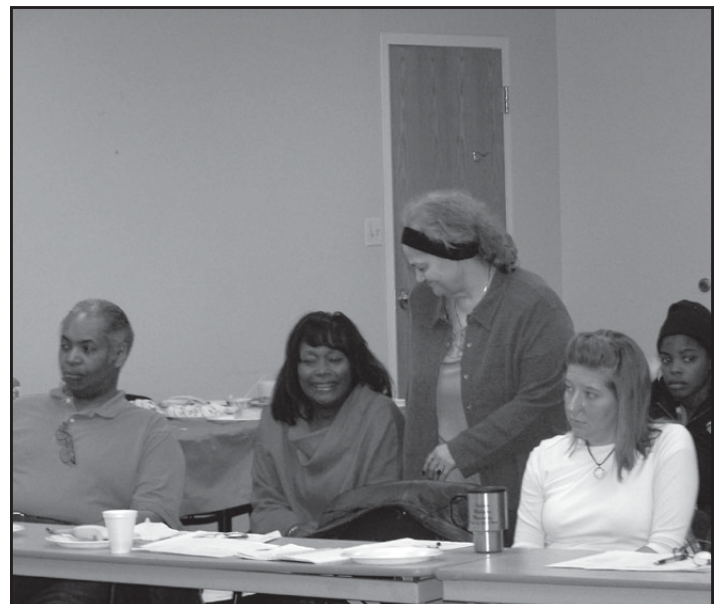
Los miembros de la Junta Asesora DCFS de Padres de Crianza Temporal de Cook Sur se reúnen mensualmente para revisar los cambios a las políticas.