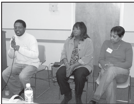
Uno de los puntos sobresalientes del Seminario para Proveedores de Cuidados del condado Cook fue el panel de padres y padres de crianza temporal compartiendo sus experiencias.