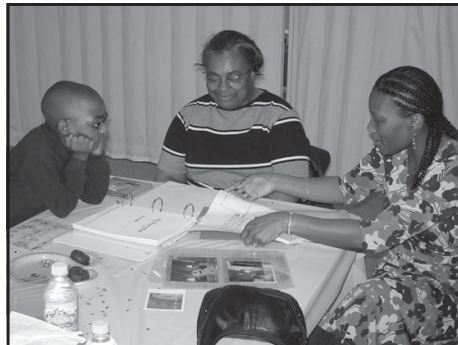
Jóvenes, trabajadores de caso, y sus proveedores de cuidados crearon libros de vida en las fiestas patrocinadas por el personal de adopción de Cook Norte.

Haciendo libros de vida como una fiesta es una manera excelente de demostrar a los proveedores de