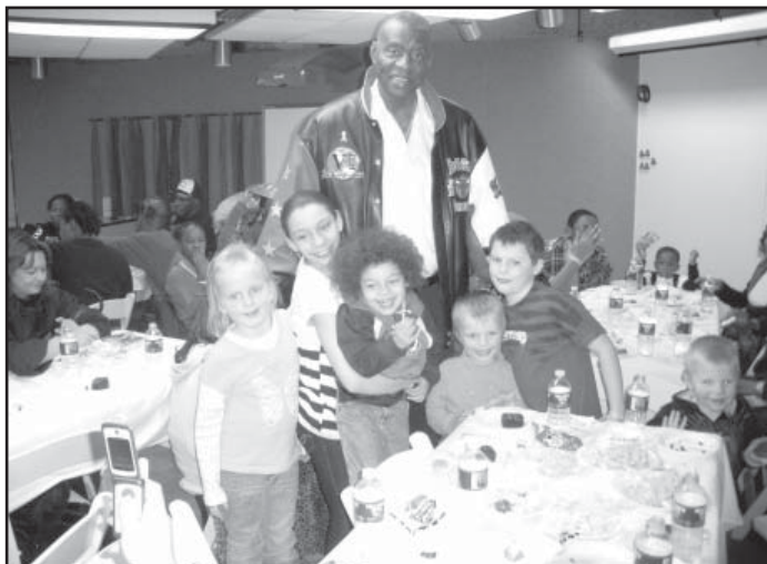
Los niños comieron y se divirtieron luego de explorar el Shedd Aquarium.

Más de 200 padres e hijos se unieron a los Chicago Bulls en el Shedd Aquarium para celebrar estas fiestas. Las leyendas de los Bulls, Bob Love y Sidney Green, y el nuevo jugador de los Bulls, John Lucas, también participaron del evento. Los jugadores ayudaron a servir la comida, entregaron regalos y firmaron autógrafos. Con la ayuda de Hinkley Springs, Edy's Grand Ice Cream y Country House Restaurant, las familias comieron y se divirtieron.