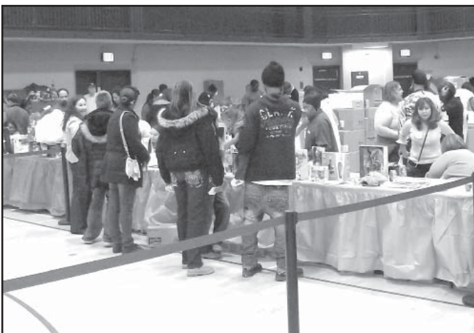
El personal del DCFS trabajó voluntariamente durante horas para recolectar y distribuir los regalos a las familias.

Durante 17 años, la Fundación Walter y Connie Payton ha ayudado al DCFS a entregar regalos a los niños que están en programas de cuidados de crianza. También se encarga de dar regalos a los jóvenes que viven en centros residenciales, programas de vida independiente, las Fuerzas Armadas y el programa Youth in College del DCFS.