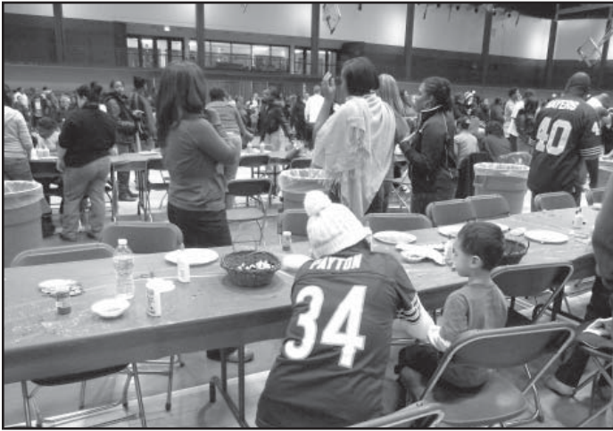
La decoración de galletas fue sólo una de las actividades divertidas de la fiesta navideña de la Fundación Payton.